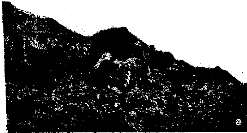
المؤلف يتسلق إحدى هضاب جبل أحد أثناء تجواله حول مواقع المعركة